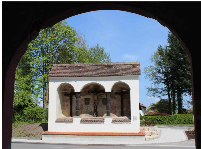
Die frisch renovierte Schächerkapelle in Heiligkreuztal.

An alle, die zur Renovierung der Schächerkapelle in Heiligkreuztal beigetragen haben.